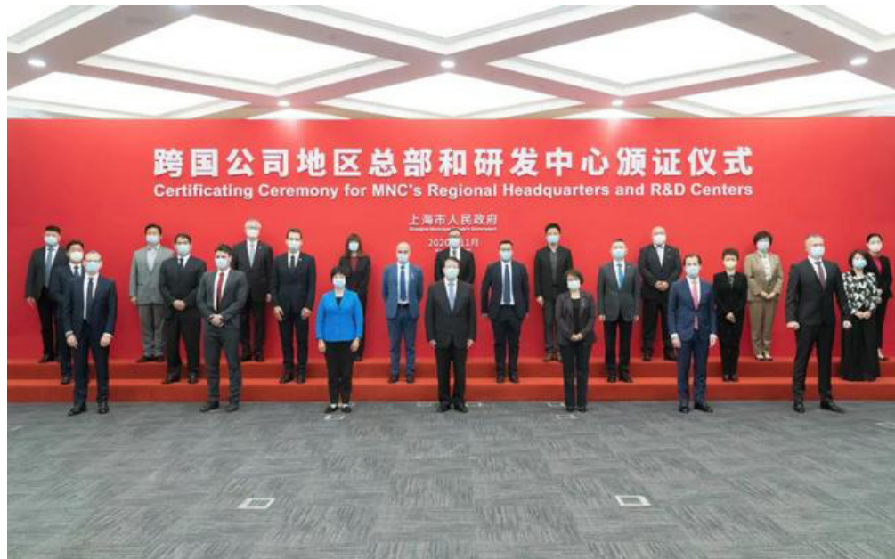
图4:上海市市长龚正为跨国公司地区总部和研发中心颁发证书

增长额达到23.23亿美元。上海在金融等服务行业的开放提升了外商投资企业的经营自主性和投资积极性,在2020年全年上海新增外商投资企业构成中,约77.3%为外商独资企业。 1