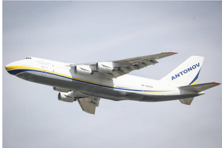
图1:世界第二大运输机安-124来浦东机场“自提”物资

巴斯德所、复旦、交大、同济等科研院所与泰国、新加坡、以色列等国相关机构围绕诊断技术、药物研发等开展合作攻关；沪上知名医疗机构和重要抗疫专家针对相关国家与人群开展常态化防疫知识交流。《张文宏教授支招防控新型冠状病毒》已实现18个语种的版权输出。